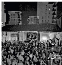
Il Mare Culturale Urbano, dove è ospite Picco

Alla Locanda alla mano dalle 18 alle 23 chiunque può salire sul palco e cantare o suonare un brano italiano o straniero con la No singer band