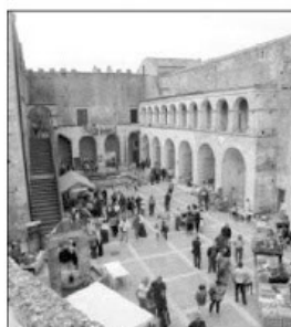
Il castello di Miglionico