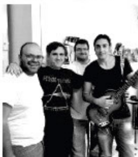
Il gruppo "Granny Smith"

L'appuntamento è questa sera in piazza San Rocco Sul palco i "Granny Smith"