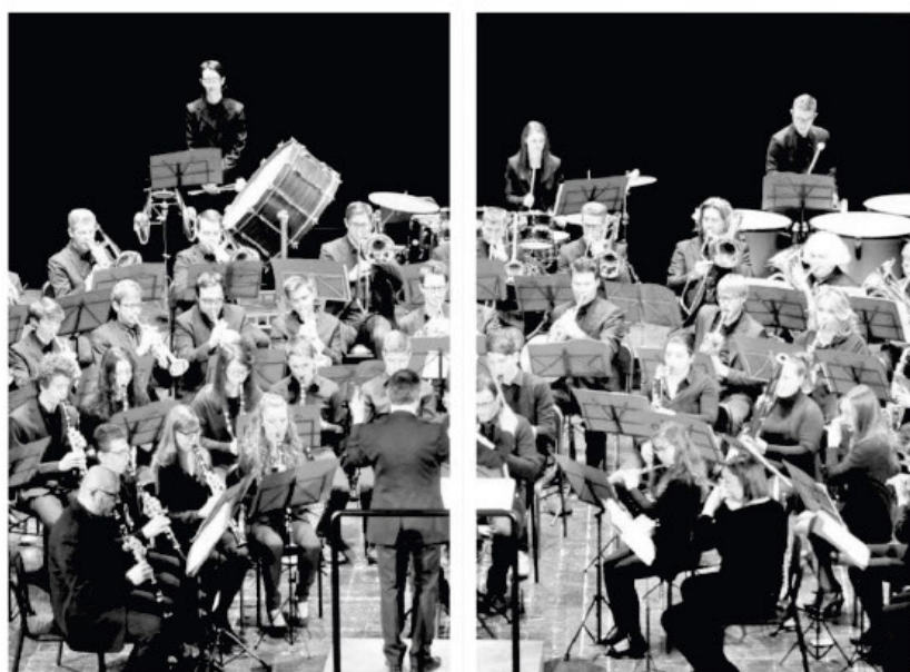
Un'immagine grandangolare dell'Orchestra di Santa Cecilia