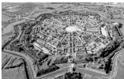
Palmanova è tra le città d'Europa che ospiteranno oggi la Festa della musica