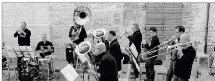
La Festa della musica Da Nord a Sud sono coinvolti tutti coloro che fanno musica sia dal punto di vista professionale che amatoriale

Mercoledì in Europa si celebra la Festa della musica Tutti gli appuntamenti in Umbria a cominciare da Todi