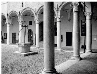
Lo spettacolo gratuito si terrà dalle 21 nel cortile del Palazzo dei principi