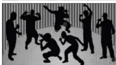
Due momenti musicali