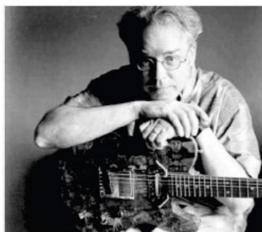
BILL FRISELL La chitarra è la star della rassegna estiva di musica. Tra gli interpreti anche John Scofield