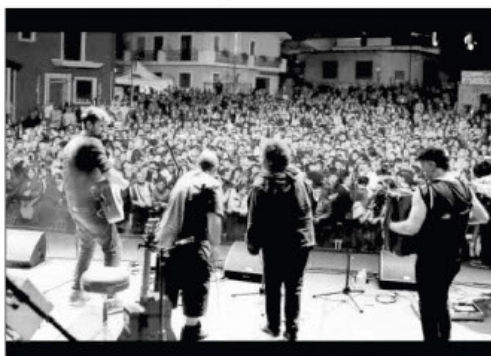
La passata edizione della festa della musica a San Nicola