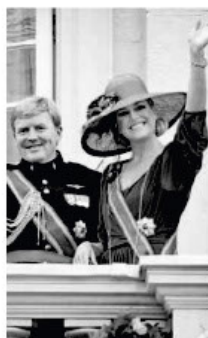
Re Willem Alexander dei Paesi Bassi e la Regina Maxima

RE WILLEM ALEXANDER E LA CONSORTE REGINA MAXIMA ARRIVANO DOMANI CONCERTONE A PIAZZA FARNESE