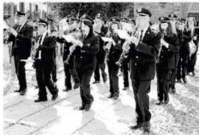
La Banda di Santa Cecilia chiuderà la Festa della musica domani sera