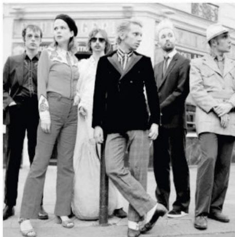
La Femme Il loro concerto nella splendida location dell'Ambasciata di Francia

mie, conservatori, scuole di musica, università, solisti, cori, fanfare e bande dell'esercito, orchestre, gruppi e bande musicali, in una parola tutti coloro che fanno musica sia dal punto di vista professionale che amatoriale. Dal Nord a Sud passando per le isole, coinvolgendo quei luoghi magici del Milano che rappresentano il fiore all'occhiello del sistema Paese. «La strada suona» ha dichiarato il Ministro dei Beni e delle Attività Culturali e del Turismo, Dario Franceschini - è il tema scelto per la Festa della Musica 2017 che torna quest'anno con un'importante partecipazione di artisti e un significativo incremento delle città coinvolte, cresciute dell'85% rispetto al 2016. Musicisti amatoriali e professionisti si uniranno per far risuonare ogni genere di melodia nelle strade di centinaia di borghi e città e celebrare l'inizio dell'estate. «Sarete lieti di rinnovare il sostegno alla Festa della Musica - ha dichiarato il Presidente di SIAE, Filippo Sugar - una manifestazione di respiro europeo che celebra la musica dal vivo, creando occasioni di socialità e dando la possibilità ad autori, artisti e musicisti di esibirsi in tutti i luoghi pubblici, dai parchi ai musei e soprattutto nelle strade e nelle piazze delle incantevoli città del nostro Paese, grazie al Milano ».