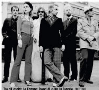
Tra gli ospiti: La Femme, band di culto in Francia.

LIVE Si terrà domani dalle 18 alle 24 in vari luoghi della città la 32esima edizione della Festa della Musica. Novità di quest'anno è che per la prima volta i cittadini avranno la possibilità di fare musica, in un programma già fitto di eventi organizzati da accademie, ambasciate, biblioteche, centri anziani, scuole, carceri, librerie, teatri, istituti di cultura, ospedali, centri sportivi e locali. Spicca fra gli ap-