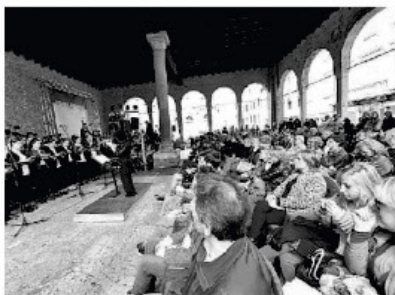
Loggia dei Cavalieri, una delle location prescelte