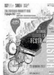
Mercoledì 21 giugno prima tappa della Festa della musica